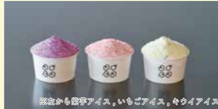
※左から紫芋アイス、いちごアイス、キウイアイス

BJを使って、地元食材を活かした季節のアイスを提供。飽和しつつあるアイス市場の中で独自性を打ち出すとともに、農家さんと協力し、「農家の味をそのままアイスにした」商品づくりに取り組んでいます。BJを通じて農家さんの抱える課題の解決を目指し、地域や農業の支援にも貢献しています。